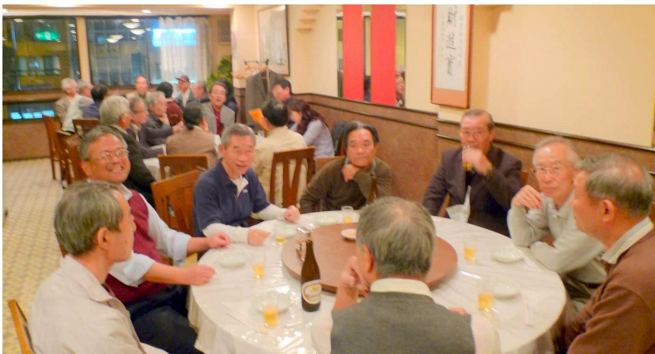
「銀賞受賞 祝賀・反省会」興隆園にて

□「銀賞」の際のIC録音(Iさん提供)をCD資料にしたものを本並先生から団員に配っていただきました。「大うた」の時の録音もはいつていますので、聞き比べて皆さんの感想はいかがですか?