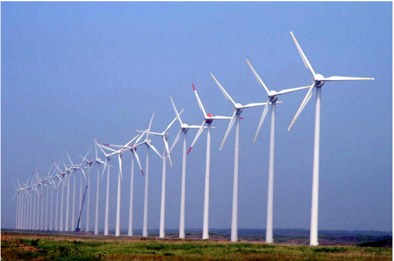
「何機ある数えてみようドン・キホーテ」

日本では大変遅れているとはいえ、風力発電も少しはあります。1枚目は整列配置型で海岸に、2枚目は分散配置型で丘陵に、どちらも北海道北部にあるものです。