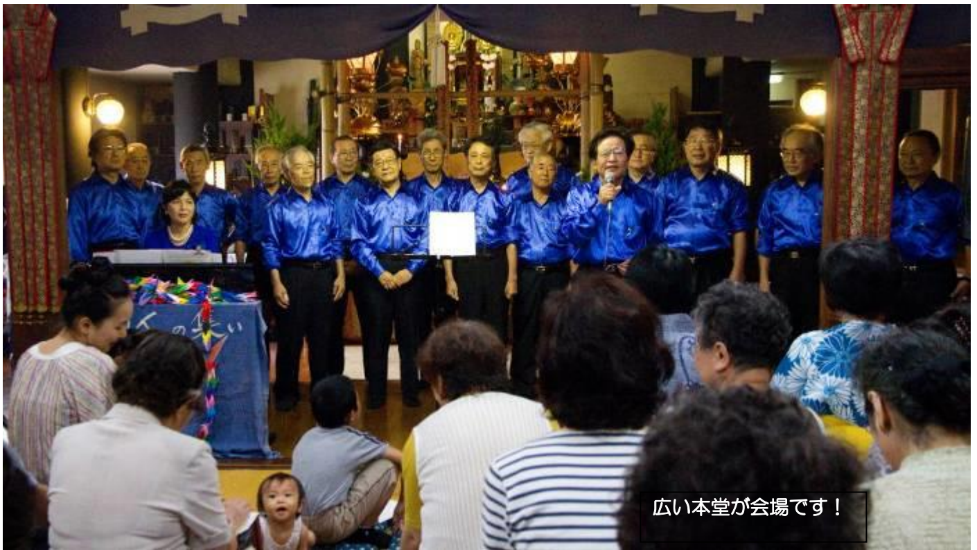
千秋新団長の挨拶「夫や息子さんをぜひ『昴』へ！」