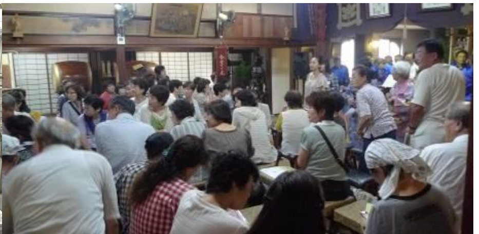
「開幕の太鼓」と聞き入るみなさん