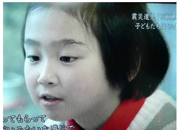
震災遺児1500人 子どもたちはいま