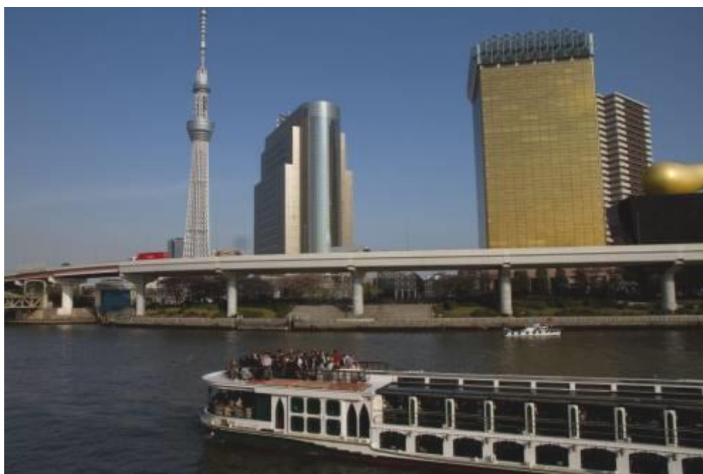
「ラッシュなり！上り下りの花見船」