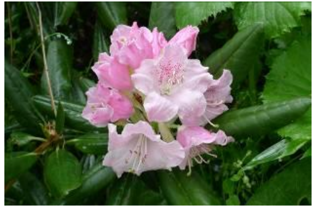
石楠花 (シャクナゲ)