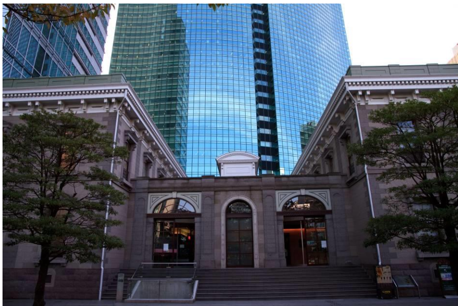
「鉄道唱歌」：旧新橋駅 大和田建樹(たけき)/作詞 多梅稚(おおのうめわか)/作曲