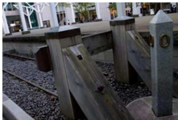
新橋停車場：「汽笛一声」あれから間もなく今年で140年 1872(明治5)年10月14日開業 1923年(大正12)年9月1日関東大震災にともなう火災のため焼失 2003年4月10日史跡「旧新橋停車場跡」として再建