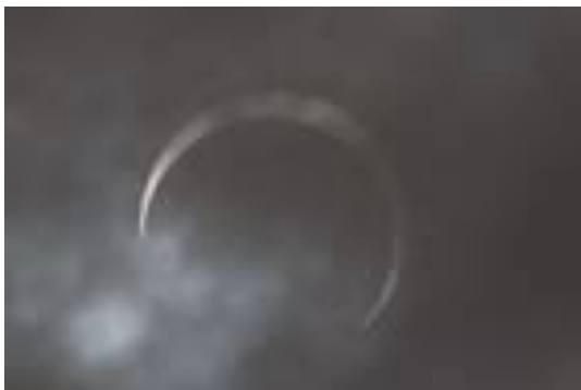
「意地悪め！金環蝕す五月雲」 2012-05-21-7:35:09 大阪市都島区友渕町1丁目にて