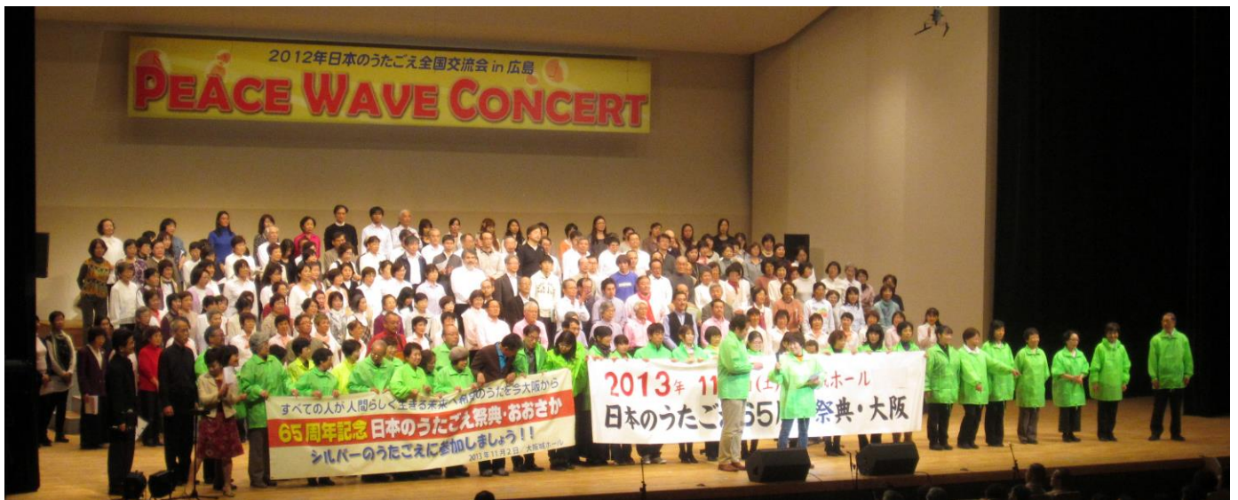
来年は日本のうたごえ祭典・おおさか

三日間皆さんとご一緒して、皆さん平均年齢七十才とは思えぬほどエネルギッシュで六十八歳の私も、いろんなところで圧倒され、私の二年後はこれほどではないのかなと思えるほどでした。