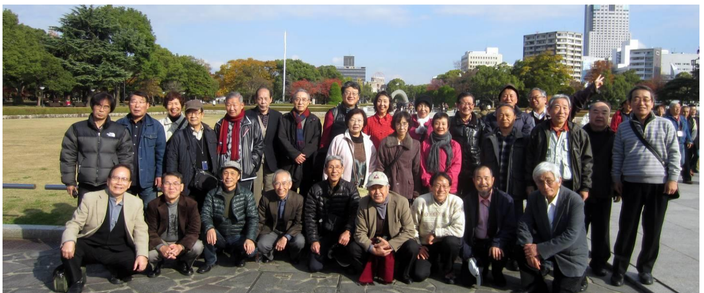
広島平和記念公園で