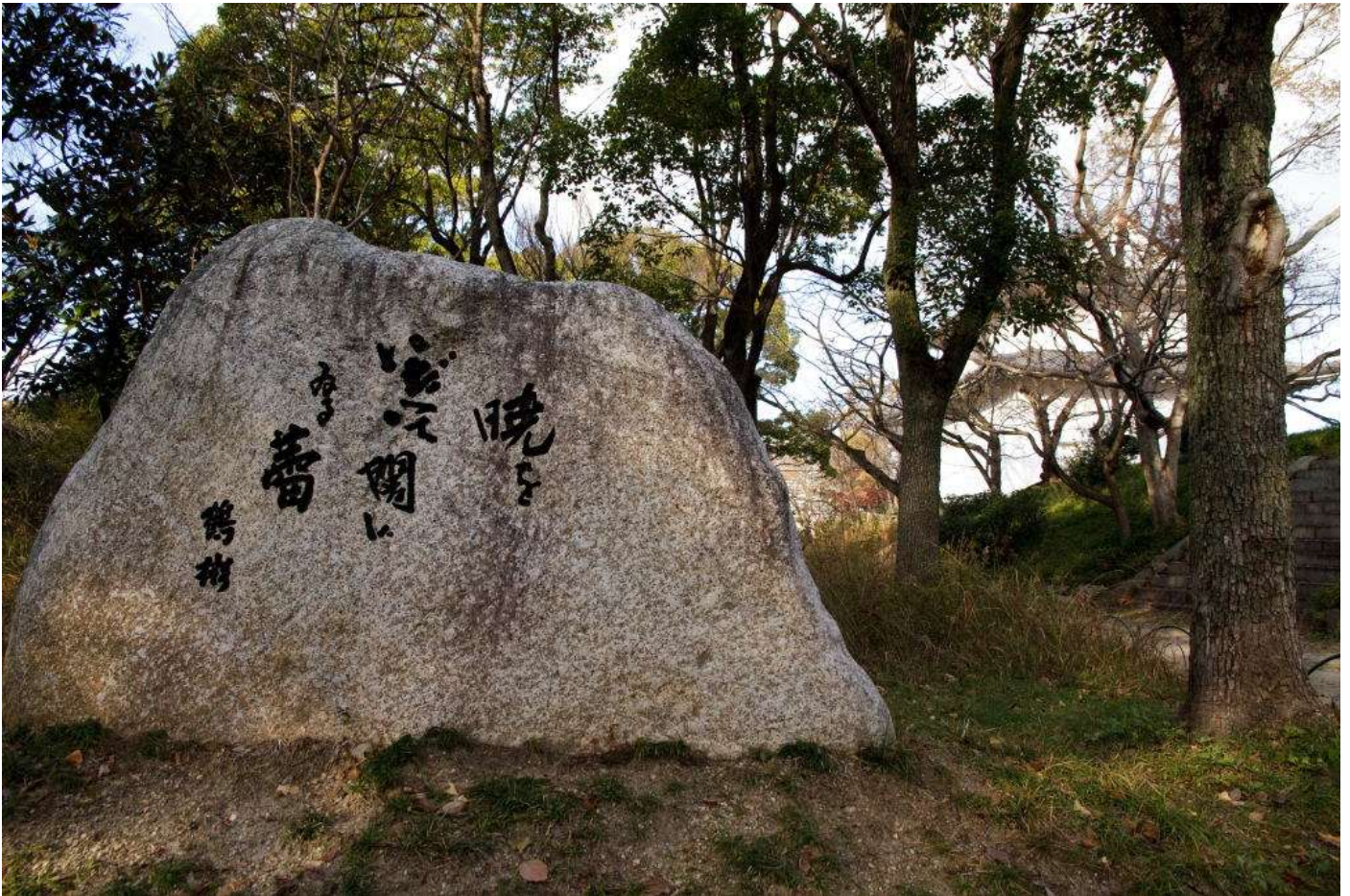
「年の瀬ややっと見つけた鶴彬」・・・丸太のことは忘ることなし

間もなく生誕 104 年(戸籍上は 1909 年 1 月 1 日、実際には前年 12 月生まれ)。右奥に見えるのは大阪城一番櫓。