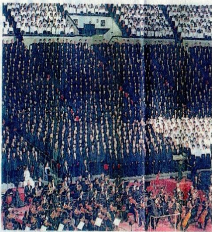
年末恒例の風物詩「1万人の第九」から =2001年12月、大阪市中央区の大城ホール