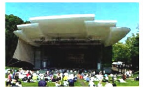
札幌芸術の森野外ステージ

歌って参加できるのは、①25日（金）の野外フェスと②26日（土）特別音楽会 I ③同日特別音楽会 II です。