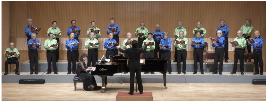
第1部 歌謡デラックス