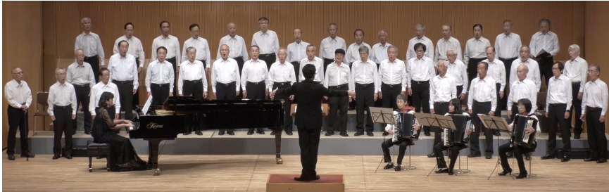
第1部 地底のうた 特別団員と共にアコ伴奏で