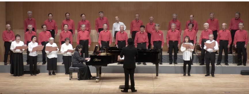
第3部 友の会会員と共に