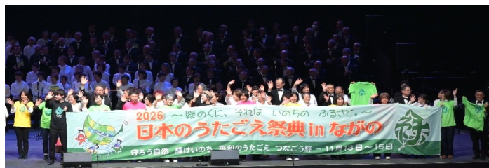
昨年の神戸祭典「大音楽会」で、長野へのバトンタッチ

特別音楽会では、混声合唱組曲「こわしてはいけない～無言館をうたう～」池辺晋一郎指揮。