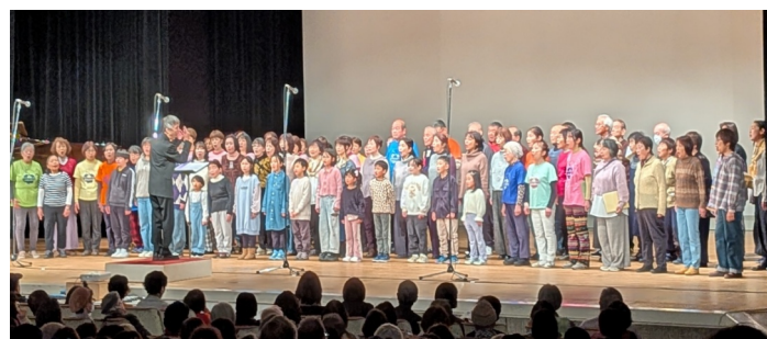
子どもたちもいっしょに、「へいわってすてきだね」で開幕