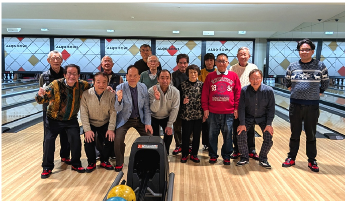
1月4日、ボウリング大会（豊中市・アルゴボウル）