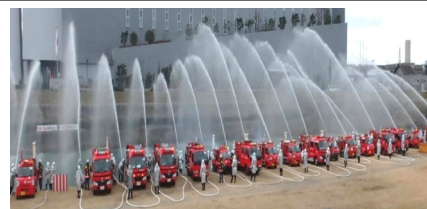
1/11 摂津市の出初め式 (神崎川河川敷)